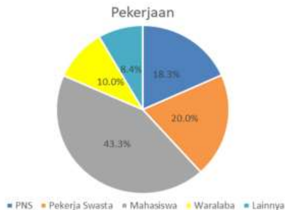
Gambar 1. Diagram Persentase Pekerjaan Responden

Responden pada penelitian ini merupakan masyarakat umum dengan objek penelitian menggunakan berbagai profesi yang terletak di Kota Mataram. Penelitian ini mengambil enam puluh responden yang mewakili masing-masing deskripsi dengan memakai metode sampling jenuh . Adapula deskriptif responden meliputi Pelajar atau Mahasiswa, Pegawai Negeri Sipil (PNS) atau pegawai BUMN, waralaba atau pebisnis, guru atau dosen, dan ibu rumah tangga.