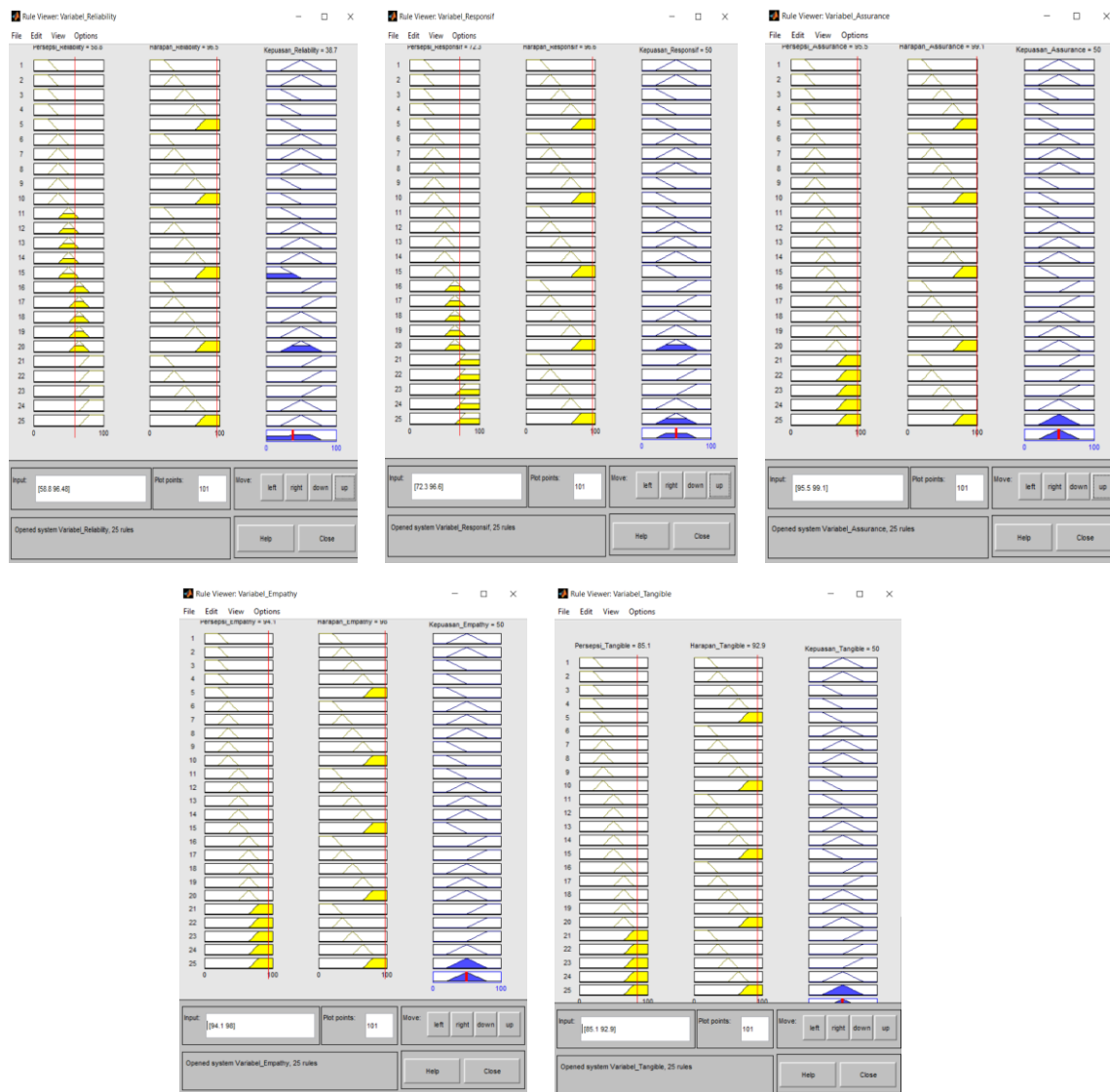
Gambar 3. Hasil Pengujian Kepuasan pada Setiap Dimensi

Nilai bilangan real 38,7 dan 50 masuk dalam domain himpunan fuzzy [20-80] yang berarti tingkat kepuasan penumpang bus Trans Patriot pada setiap dimensi dikatakan SEDANG. Gambar 3 menunjukkan hasil pengujian dengan software MATLAB untuk setiap dimensi.