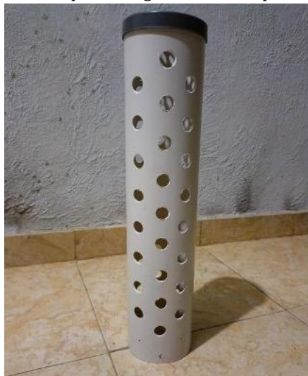
Gambar 4. LRB yang dibuat bersama masyarakat

Pendampingan pembuatan dan instalasi Lubang Resapan Biopori (LRB) di Desa Kalibarumanis merupakan langkah penting dalam memastikan keberhasilan program pengelolaan sampah organik dan peningkatan kesuburan tanah. Proses pendampingan ini dimulai dengan identifikasi lokasi-lokasi strategis untuk pemasangan LRB, terutama di area pemukiman dan kebun kopi. Tim KKN-UMD 301 Universitas Jember bekerja sama dengan masyarakat untuk memilih titik-titik yang paling efektif dalam memaksimalkan fungsi LRB, baik sebagai alat pengolahan sampah organik maupun sebagai sarana resapan air.